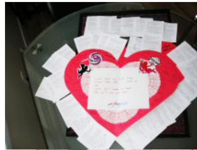
Une carte de la Saint-Valentin envoyée à Lantic de la communauté de Comox (CB)

Des milliers de Canadiens ont été actifs pendant la campagne, certains ont écrit des cartes postales, d'autres ont fait parvenir des lettres à Lantic, et plusieurs collectivités ont coordonné leur action au niveau local. Lantic n'a pas daigné répondre à nos lettres, mais Cadbury Canada a réagi en affirmant qu'elle ne se servirait pas de sucre GM dans ses produits. Pendant ce temps, une action en justice intentée récemment aux É.-U. contre l'utilisation de la betterave GM pourrait éventuellement modifier le déroulement de notre campagne au Canada.